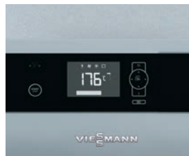
Régulation Ecotronic 100 à écran lumineux pour une commande simple et intuitive

La Vitoligno 150-S est une chaudière compacte à gazéification pour bûches de bois, d'un prix particulièrement attrayant, adaptable à un fonctionnement monovalent ou à un fonctionnement bivalent (complément à une installation de chauffage au fioul ou au gaz).